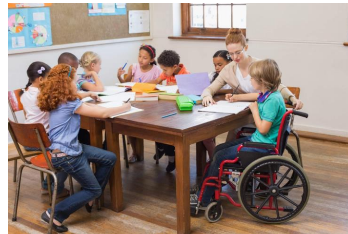
Воспитатель детей дошкольного возраста, в том числе с ограниченными возможностями здоровья

Суть специальности: Подготовка воспитателей для работы с детьми дошкольного возраста с ограниченными возможностями здоровья (ОВЗ), а также с сохранным развитием в инклюзивных группах.