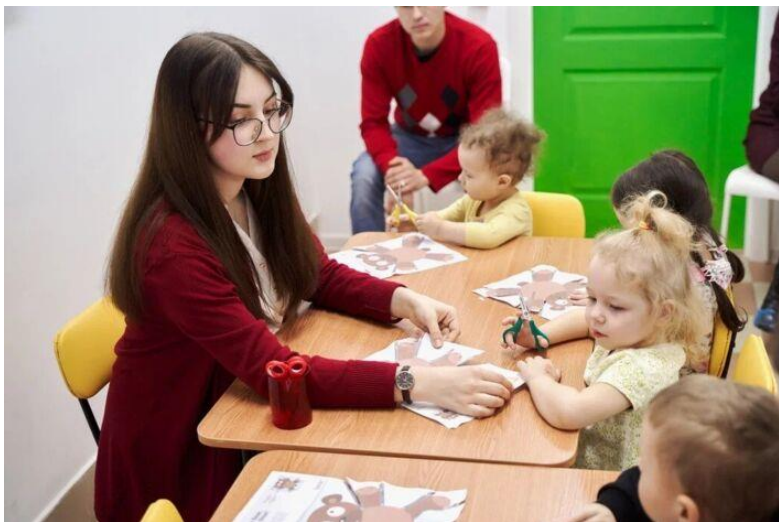
Педагог дополнительного образования (в области Изобразительного и Декоративно-прикладного искусства)

Суть специальности: подготовка педагогов в сфере изобразительного искусства и декоративно-прикладного творчества.