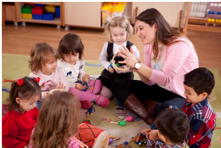
Воспитатель детей дошкольного возраста

Суть специальности: подготовка педагогов для работы с детьми дошкольного возраста (от 3 до 7 лет) в детских садах, развивающих центрах и семейных клубах.