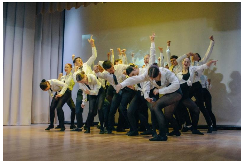
Педагог дополнительного образования (в области хореографии)

Суть специальности: подготовка педагогов в области хореографического искусства для работы в образовательных и культурно-досуговых учреждениях.