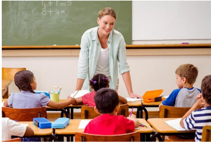
Преподавание в начальных классах

Суть специальности: подготовка учителей для работы с учащимися 1–4 классов в общеобразовательных школах.