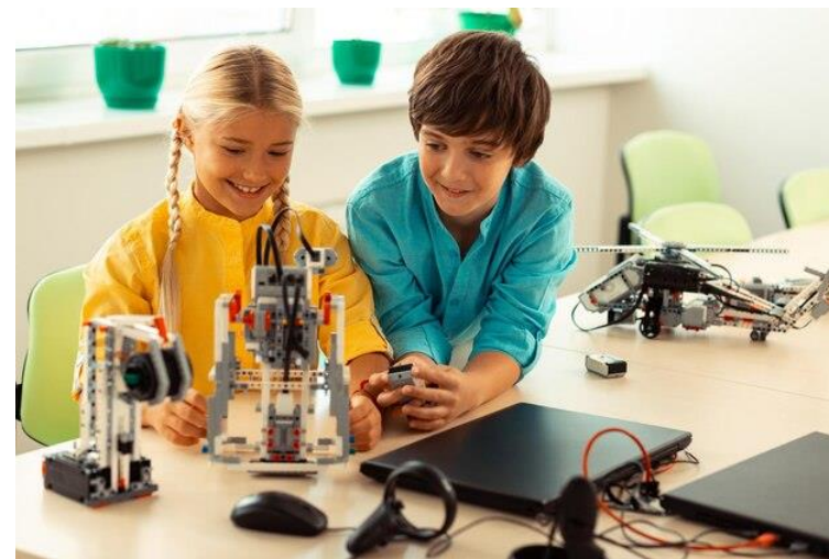
Педагог дополнительного образования (в области технического творчества)

Суть специальности: организация обучения детей вне учебных заведений по направлению «техническое моделирование, конструирование, спортивное пилотирование».