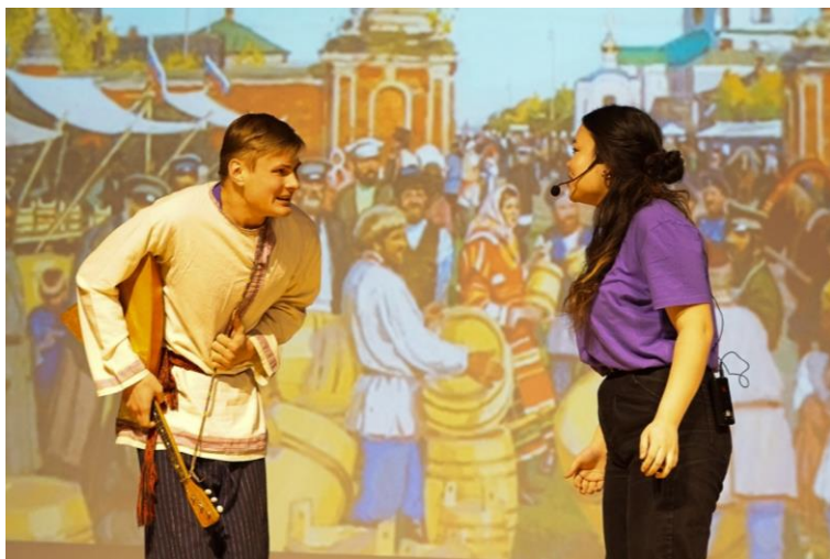
Педагог дополнительного образования (в области сценической деятельности)

Суть специальности: подготовка педагогов и творческих специалистов в сфере сценического искусства для работы в образовательных и культурно-досуговых учреждениях.